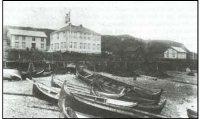
Her er et bilde fra Loppa ca 1900 med skolen til venstre og prestegården til høyre og handelsmannens hus i midten og med båtene i støa